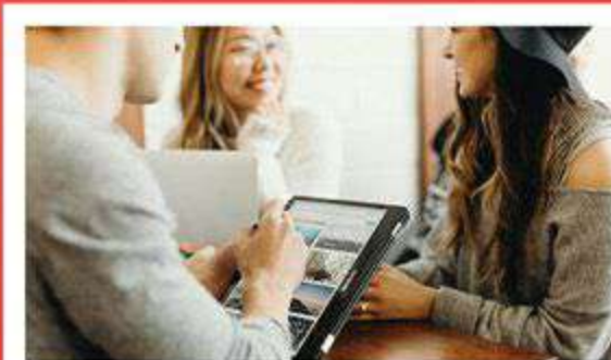
企业 - 生命赋权