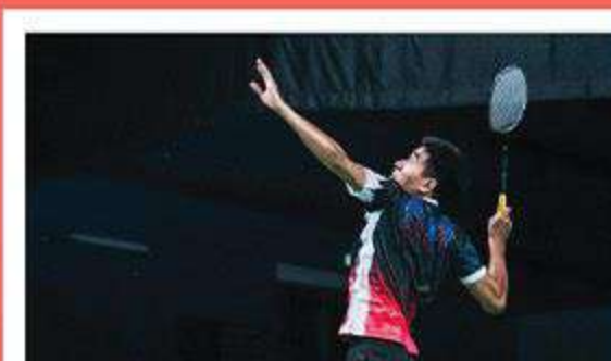
体育 - 羽毛球, 室内足球, 爬山