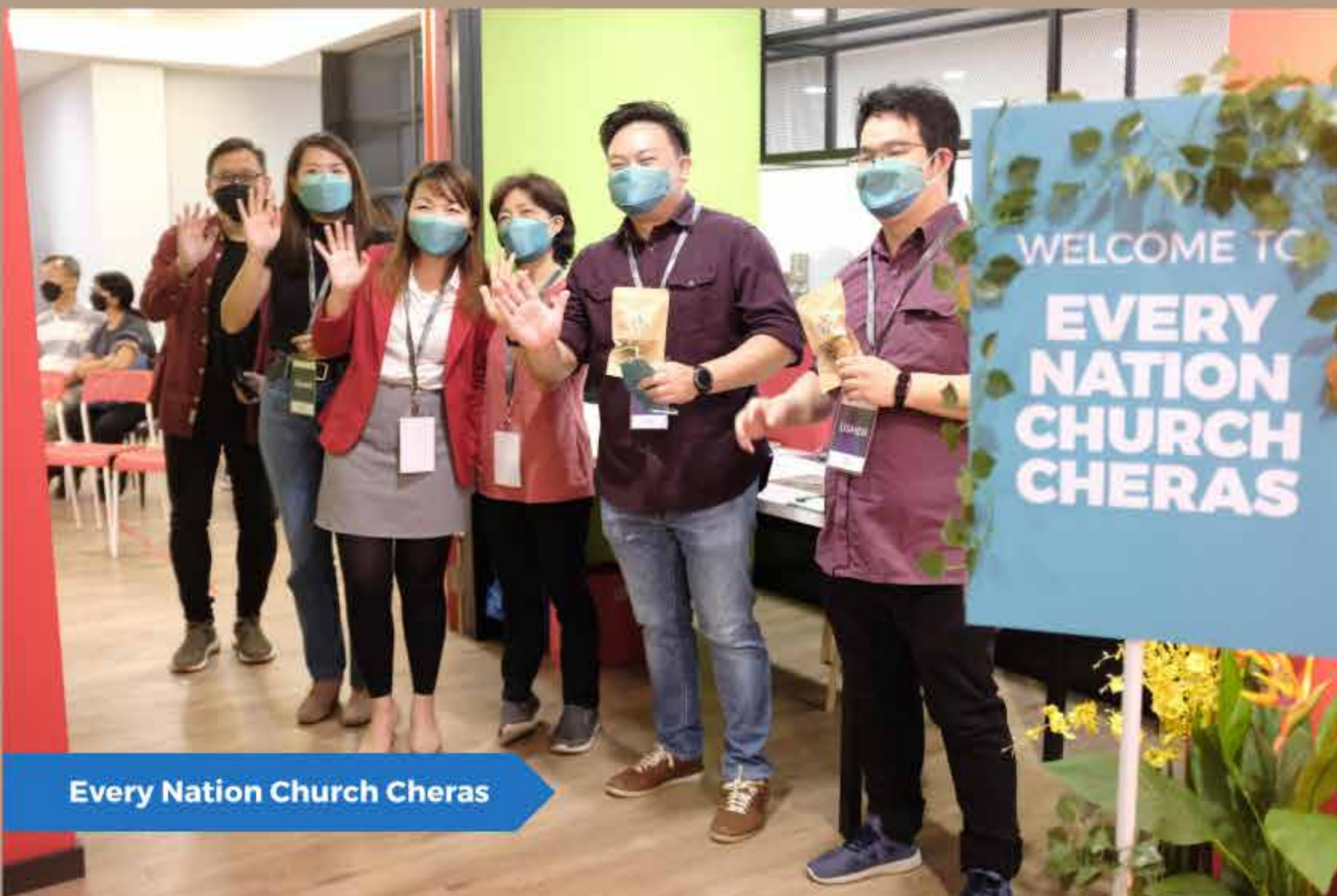
Every Nation Church Cheras