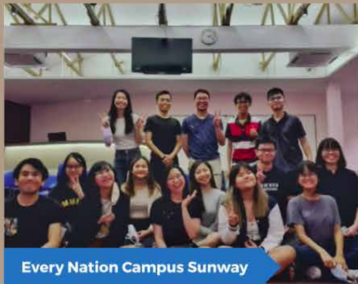
Every Nation Campus Sunway