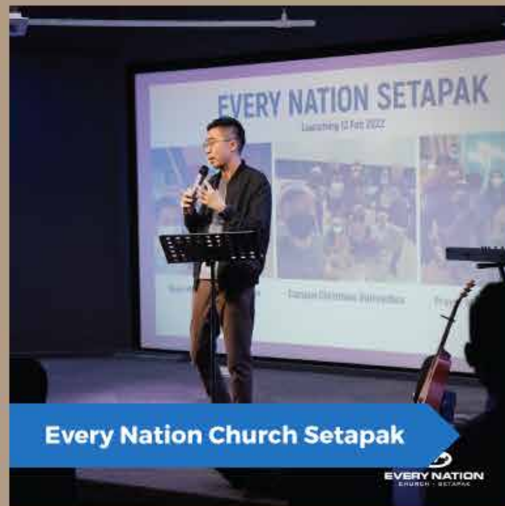
Every Nation Church Setapak