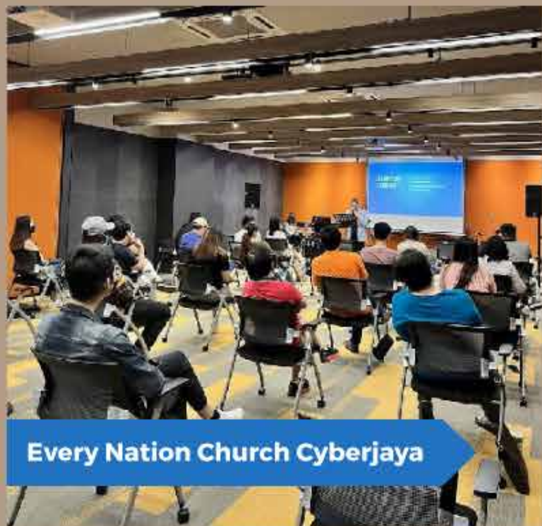
Every Nation Church Cyberjaya