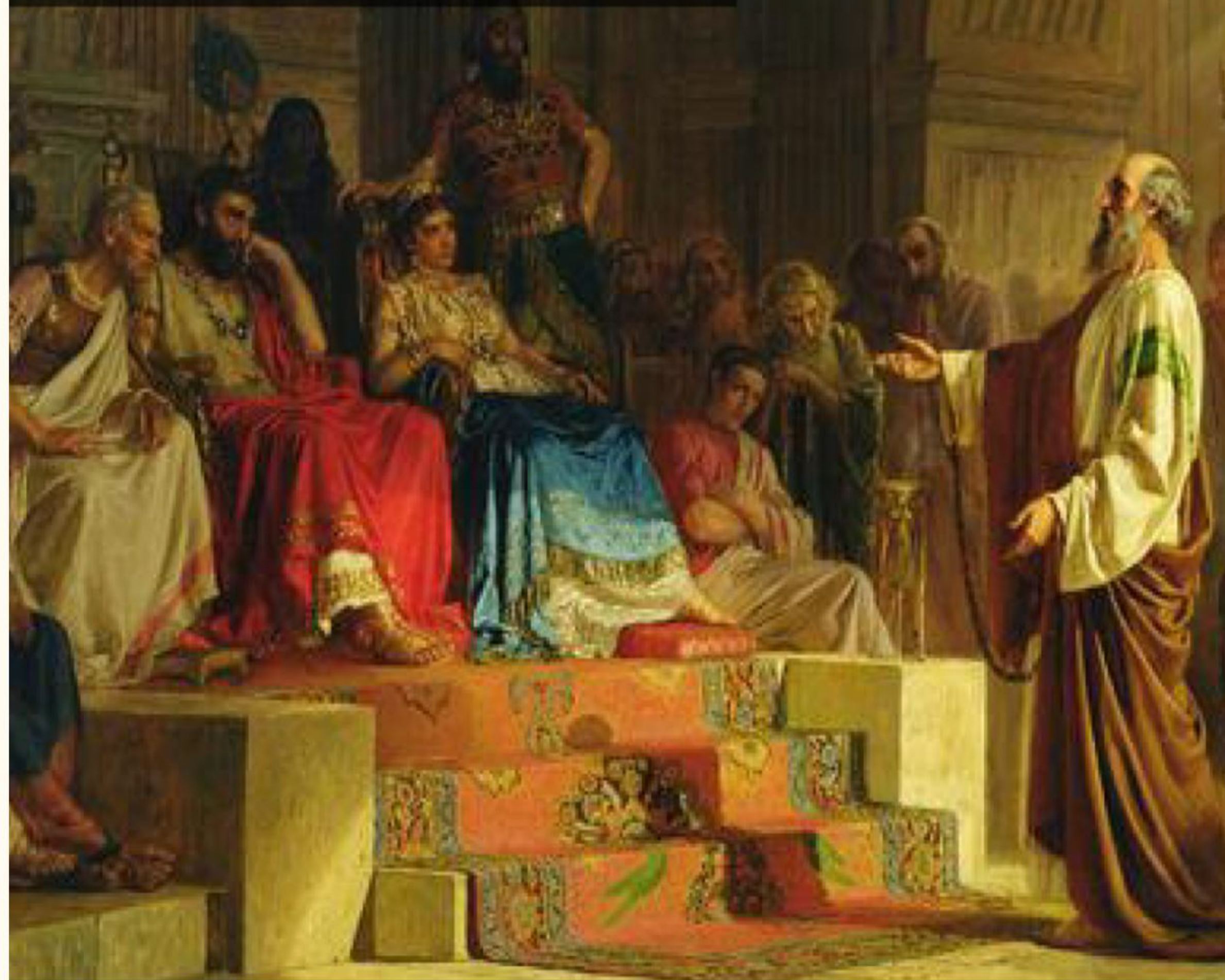
希律·亞基帕二世 Herod Agrippa II