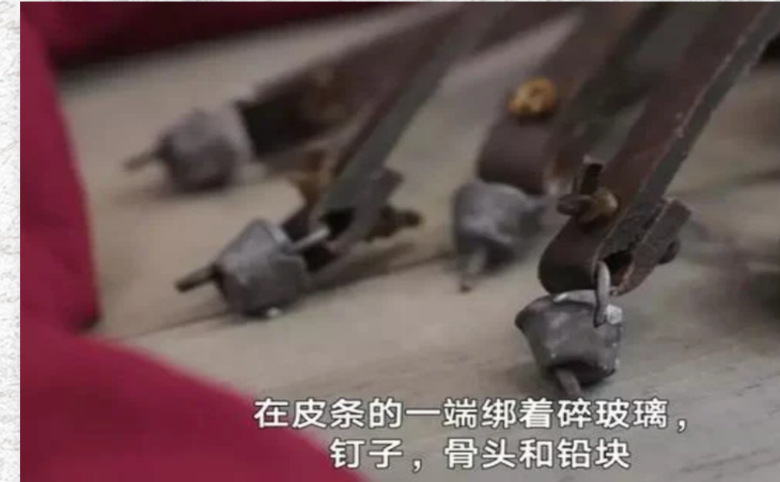
在皮条的一端绑着碎玻璃， 钉子，骨头和铅块

祂。 4 其实祂担当了我们的忧患，背负了 我们的痛苦。我们却以为是上帝责罚、 击打、苦待祂。 5 谁知祂是因我们的过犯 而被刺透，因我们的罪恶而被压伤。我们 因祂所受的刑罚而得到平安，因祂所受的 鞭伤而得到医治。